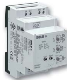
Isolationswächter RN 5897/300