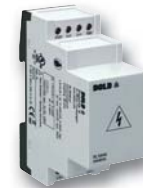
Vorschaltgerät RL 5898