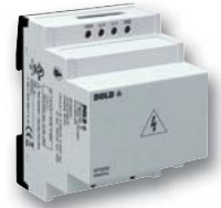
Vorschaltgerät RP 5898