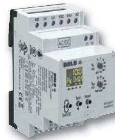
Isolationswächter RN 5897