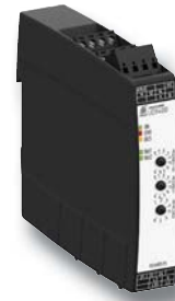
Multifunktionales Messrelais UG 9400