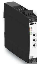
Multifunktionales Messrelais UG 9400