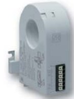
Differenzstromwandler ND 5015