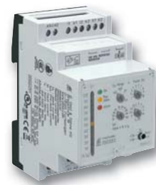
Differenzstromwächter RN 5883