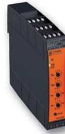
Softstarter UG 9019