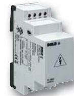
Vorschaltgerät RL 5898