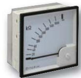
Anzeigeelement RP 5898