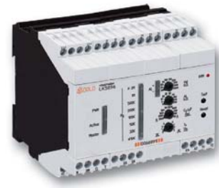
Isolationswächter LK 5896/900