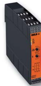
Sicherer sensorloser Stillstandswächter UG 6946